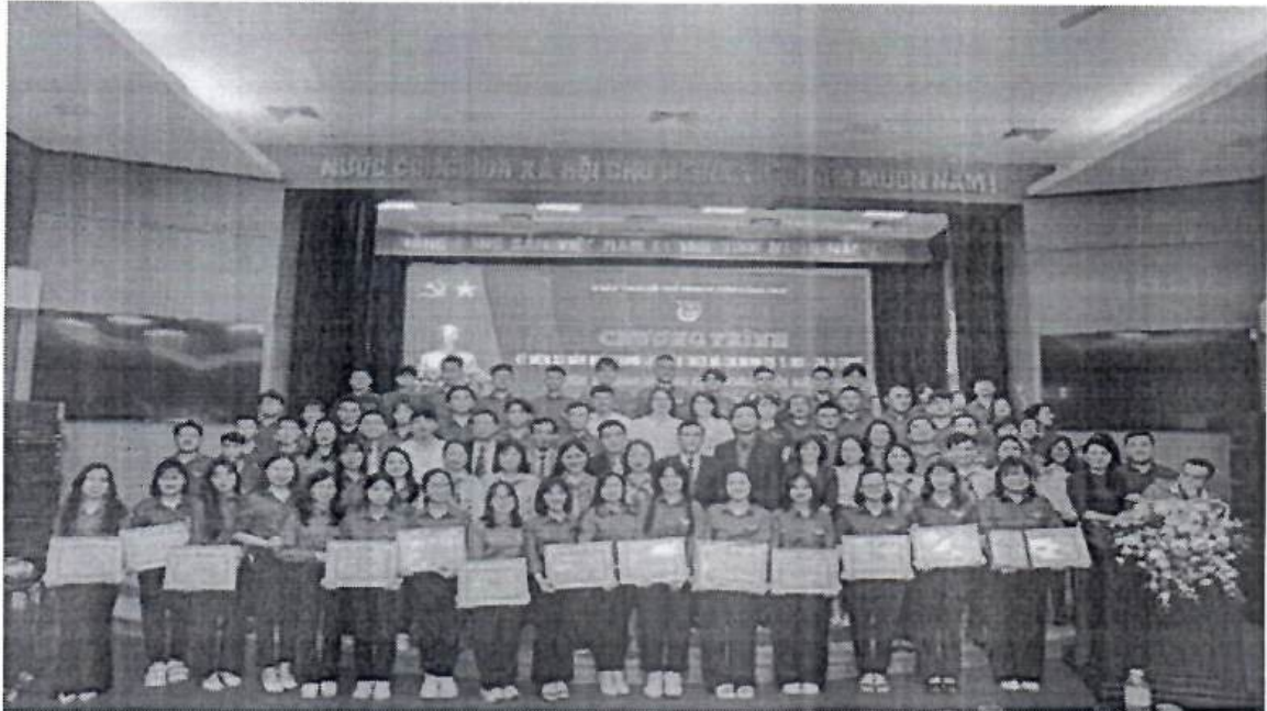
Miza hướng tới kỷ niệm 93 năm ngày thành lập đoàn TNCS Hồ Chí Minh

Nhân dịp Tháng Thanh niên năm 2024, ngày 22/03/2024, được sự nhất trí của Thường trực Huyện ủy, Huyện Đoàn Đông Anh trang trọng tổ chức Chương trình kỷ niệm 93 năm Ngày thành lập Đoàn TNCS Hồ Chí Minh. Cũng nhân dịp này, Đoàn TNCS Hồ Chí Minh Huyện Đông Anh đã tổ chức tuyên dương các cá nhân và tập thể có đóng góp tích cực trong các phong trào Đoàn đội của Huyện nhà.