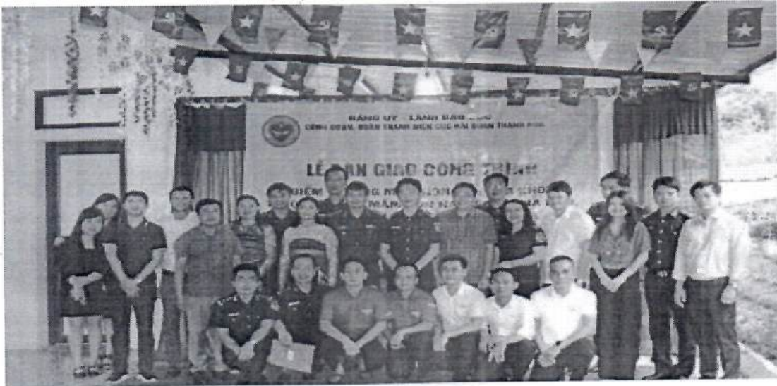
Miza Nghi Sơn chung tay bàn giao công trình sửa chữa điểm trường mầm non Chà Khót

Ngày 28/10/2023, Công ty TNHH Miza Nghi Sơn chung tay cùng Công đoàn Cục Hải quan Thanh Hóa đã phối hợp với chính quyền địa phương xã Na Mèo (Quan Sơn, Thanh Hóa) tổ chức bàn giao công trình điểm trường mầm non Bàn Cha Khót, thuộc trường mầm non xã Na Mèo sau cải tạo, sửa chữa.