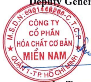
Le Tung Lam