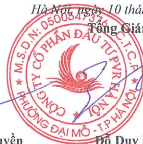
Đỗ Duy Điền