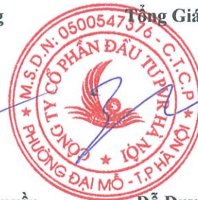
Đỗ Duy Điền