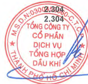
Phùng Tuấn Hà Chủ tịch Hội đồng Quản trị Ngày 27 tháng 3 năm 2026

Các thuyết minh từ trang 10 đến trang 58 là một phần cấu thành báo cáo tài chính hợp nhất này.