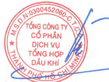
Phùng Tuấn Hà Chủ tịch Hội đồng Quản trị Ngày 27 tháng 3 năm 2026

Các thuyết minh từ trang 10 đến trang 58 là một phần cấu thành báo cáo tài chính hợp nhất này.