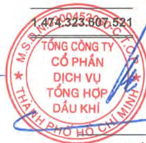
Phùng Tuấn Hà Chủ tịch Hội đồng Quản trị Ngày 27 tháng 3 năm 2026

Các thuyết minh từ trang 10 đến trang 58 là một phần cấu thành báo cáo tài chính hợp nhất này.