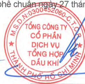
Phùng Tuấn Hà Chủ tịch Hội đồng Quản trị