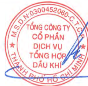
Phùng Tuấn Hà Chủ tịch Hội đồng Quản trị Ngày 27 tháng 3 năm 2026

Các thuyết minh từ trang 10 đến trang 56 là một phần cấu thành báo cáo tài chính riêng này.