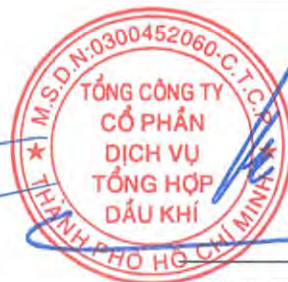
Phùng Tuấn Hà Chủ tịch Hội đồng Quản trị Ngày 27 tháng 3 năm 2026

Các thuyết minh từ trang 10 đến trang 56 là một phần cấu thành báo cáo tài chính riêng này.