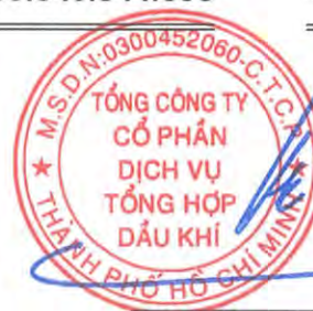
Phùng Tuấn Hà Chủ tịch Hội đồng Quản trị Ngày 27 tháng 3 năm 2026

Các thuyết minh từ trang 10 đến trang 56 là một phần cấu thành báo cáo tài chính riêng này.