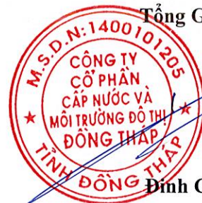
Đinh Công Phú