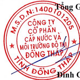
Đinh Công Phú