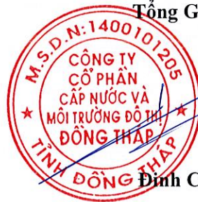
Đinh Công Phú