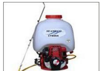
Máy phun thuốc