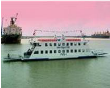
Tàu du lịch, tàu khách