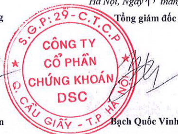
Bạch Quốc Vinh