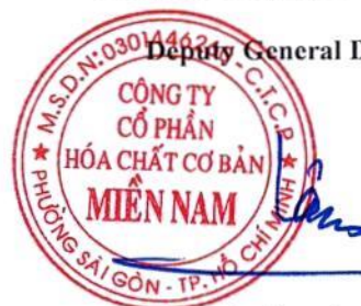
Le Tung Lam