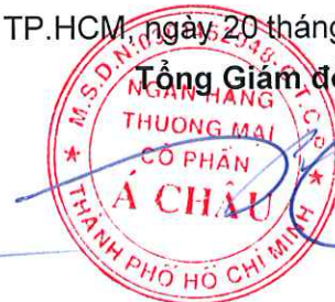
Từ Tiên Phát