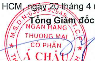
Từ Tiên Phát