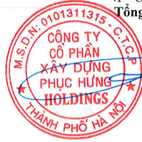
Đặng Trọng Đức