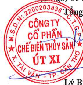
Lý Bích Quyên